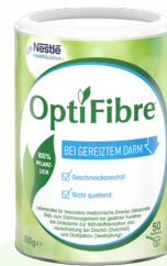
250 g Dose

OptiFibre® ist in den folgenden Größen erhältlich: